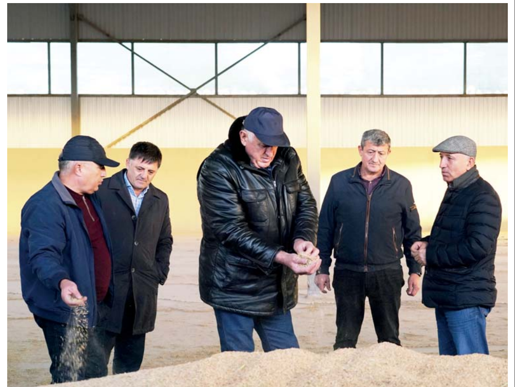
Рабочий визит заместителя Председателя Правительства РД Абдулмуслима Абдулмуслимова в Тарумовский район

- эффективно функционирует КФХ «Рутлуб» в Таловке.